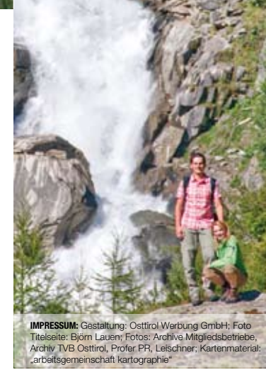
IMPRESSUM: Gestaltung: Osttirol Werbung GmbH. Kartenmaterial: „arbeitsgemeinschaft kartographie“

Mai, Juni, September, Oktober 10.00 - 17.00 Uhr Juli und August von 9.00 - 18.00 Uhr Telefon +43.50.212.410 oder +43.664.1567457